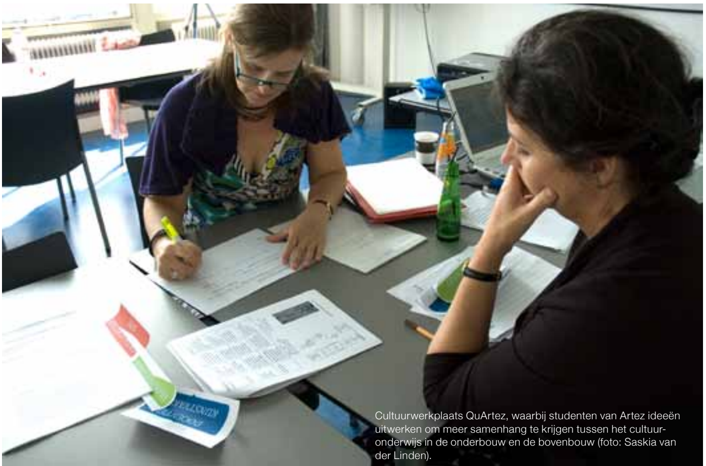
Cultuurwerkplaats QuArtez, waarbij studenten van Artez ideeën uitwerken om meer samenhang te krijgen tussen het cultuuronderwijs in de onderbouw en de bovenbouw (foto: Saskia van der Linden).

de derde klas vaak een duidelijke breuk in de opbouw. Studenten die van onze opleiding komen willen dat graag veranderen, maar dat valt niet altijd in goede aarde bij een bestaand docententeam. Wij vroegen ons af hoe je draagvlak kunt creëren om die aansluiting te verbeteren.”