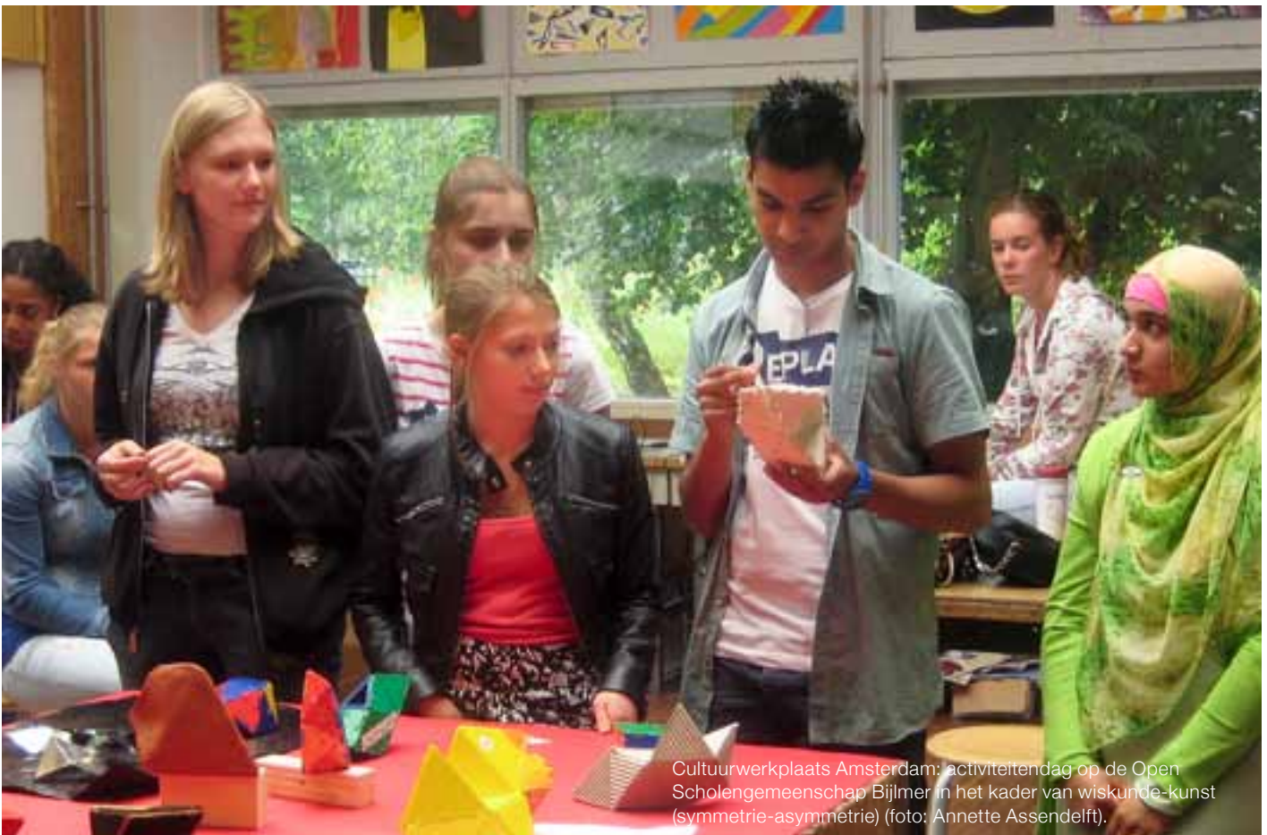
Cultuurwerkplaats Amsterdam: activiteitenendag op de Open Scholengemeenschap Bijlmer in het kader van wiskunde-kunst (symmetrie-asymmetrie).

lesprogramma. Iedereen is enthousiast, je ontwerpt immers iets nieuws dat, als het goed gaat, wiskundedocenten in het hele land gaan gebruiken.”