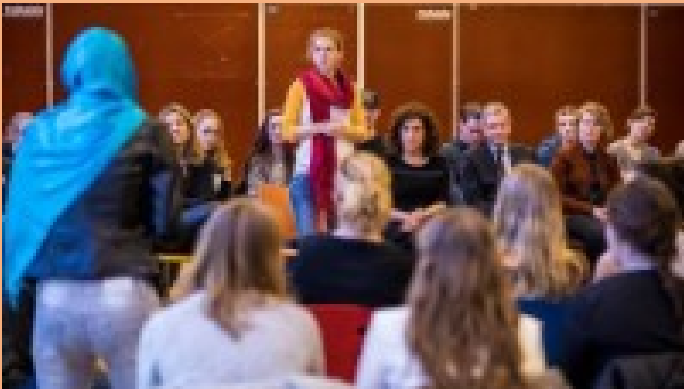
Impressie LEEF! - YouTube