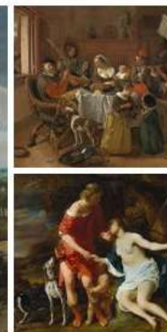
Schilderijen RIJKS MUSEUM